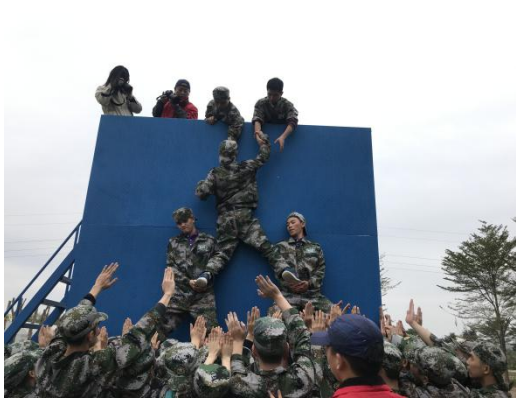
大学生户外拓展训练